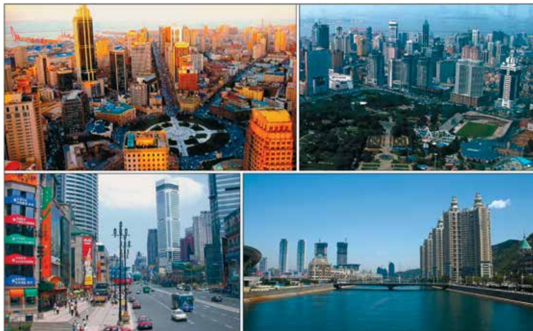
Рис. 1. Китайский Далянь.