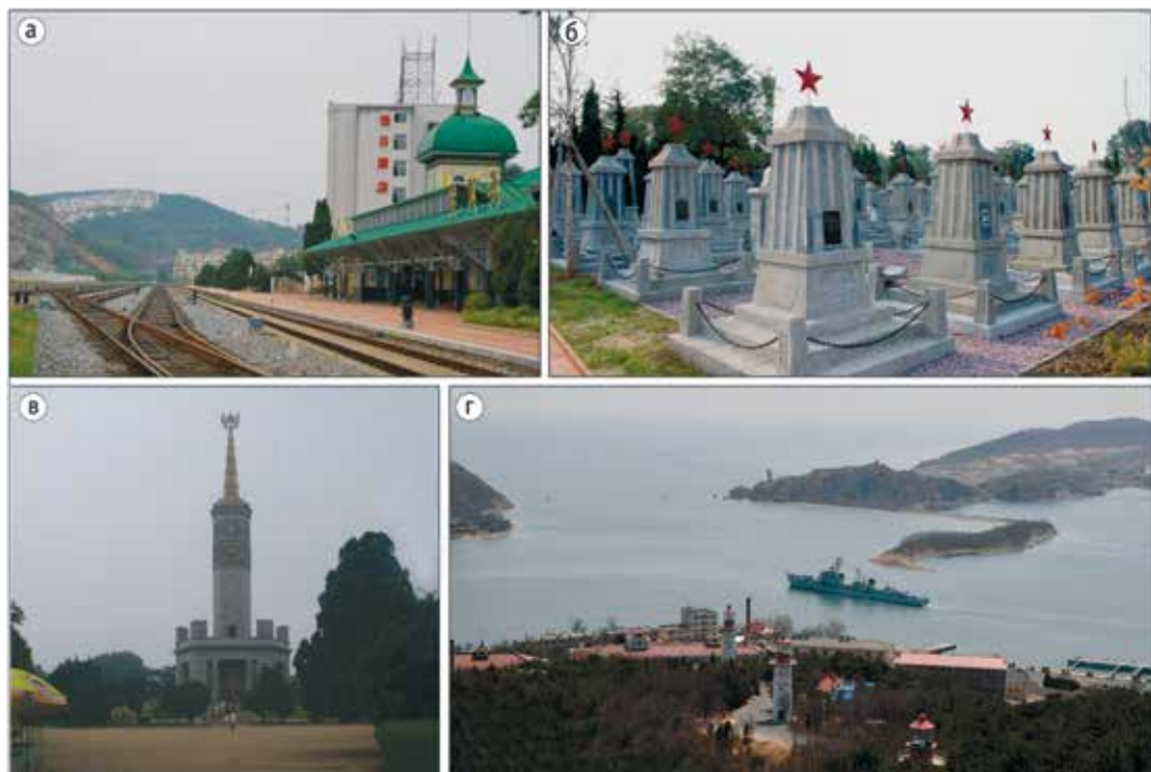
Рис. 7. Город Люйшунь (Порт-Артур): а – русский вокзал на КВЖД; б – самое большое в Китае советское мемориальное кладбище; в – стела Российско-Китайской дружбы; г – военная база морского флота КНР.

именно потому, что не отлажена система стимулирования и перспективного планирования.