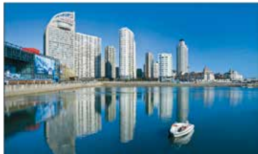
Рис. 4. Вид на отель и океанариум.

Конечно, подавляющее большинство котельных (свыше 80%) работает на угле, и это не сильно украшает атмосферу китайских городов, так что теплофи-