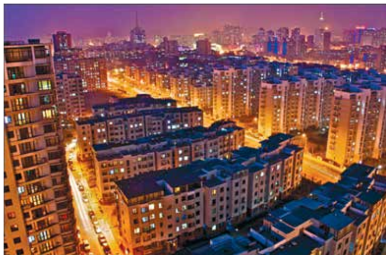
Рис. 2. Высокоплотная городская застройка.

Чья это статуя перед зданием (рис. 3), узнаете? Да, Мао Цзэдун. Никто и не думал снимать её или пачкать. Очень доброжелательная и спокойная атмосфера. Кроме волонтеров, многие студенты на улице старались показать, куда идти, видя приезжих с бейджиками.