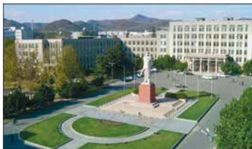
Рис. 3. Скульптура Мао Цзэдуна (Даляньский университет техники и технологий).

(рис. 5). Некогда – плотная программа конференции.