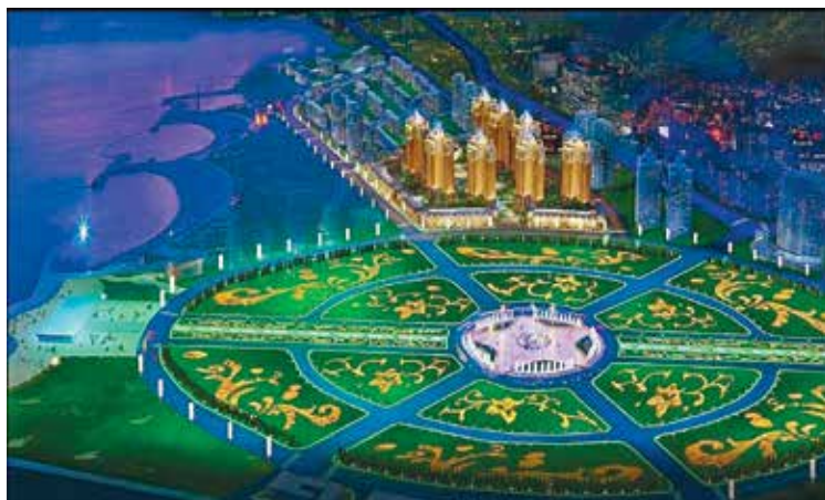
Рис. 5. Главный супер-парк на набережной.

кация (ну или – на западный манер – когенерация) является важным решением проблем экономии топлива и выбросов продуктов его сгорания. И 12-я пятилетка в КНР (2012–2017 гг.) ставит перед собой задачи интенсивного энергосбережения в электро- и теплоэнергетике.